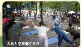
大地と空を繋ぐヨガ